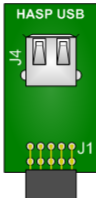
Рис. 1. Внешний вид устройства.

Более подробно о работе с ключами HASP смотрите в технической документации — « Руководство пользователя CVS HASP ».