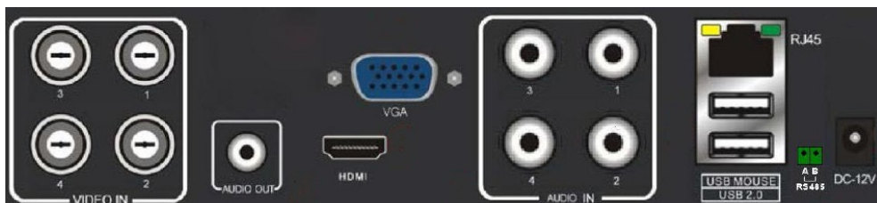
Рисунок 1: Задняя панель.

1. Подключите аналоговые камеры к BNC разъёмам устройства (Рис. 1).